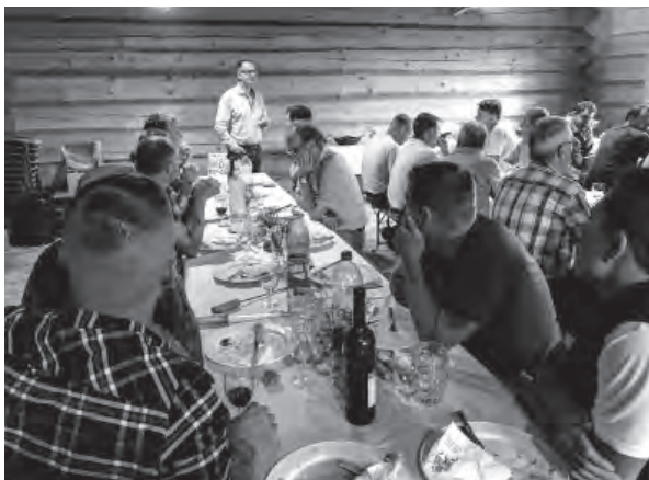
Tag der offenen Türe

Wir haben das Reservoir Rüti, und gleichzeitig das Pumpwerk Grueben an der Einweihung mit einem Tag der offenen Türe der Bevölkerung zugänglich gemacht. Viele haben die Möglichkeit genutzt, einmal in das Herz der Versorgung hineinzuschauen und die Fassung und Speicherung unseres Trinkwassers zu besichtigen.